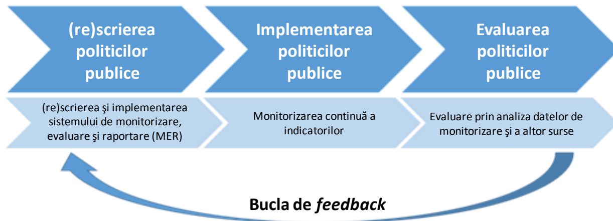
Figura 1 Ciclul elaborării, implementării și evaluării politicilor